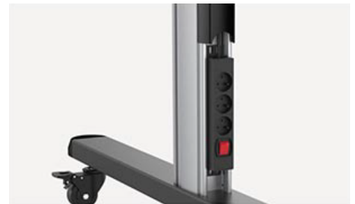
Special Slot Design for mounting additional power socket